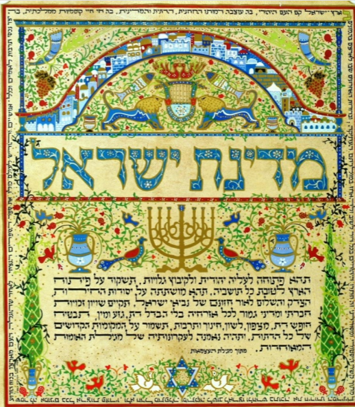
כרזה ליום העצמאות 1986. עיצוב: רפאל אבקסיס (KRA1957)